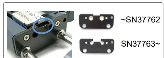
Fig.2: Unterschied zwischen altem und neuem Design des HJS-02