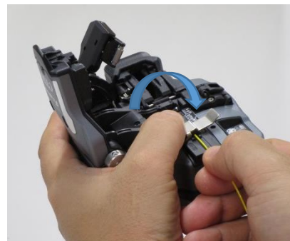
3 ) Schießen Sie die Faser- klammer AD-10-24