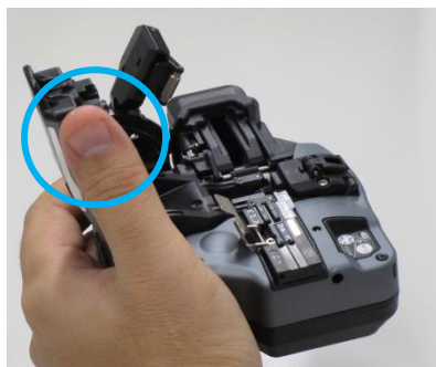
1 ) Das CT50 seitlich anfassen Achtung! Nicht die Faserklammer berühren

Das CT50, Fujikuras neues Trenngerät, bietet zahlreiche neue Funktionen wie Bluetooth Funkschnittstelle, einfache Schneidradeinstellung, Bedienung in einem Schritt usw.. Grundsätzlich ist das CT50 so gestaltet, dass man damit auf einem Tisch arbeitet. Es ist aber auch möglich, das CT50 bei der Bedienung in der Hand zu halten: