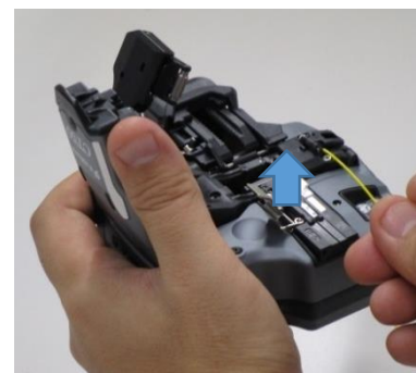
6 ) Entnehmen Sie die Faser

Von der anderen Seite betrachtet Achtung! Bitte halten Sie das Gerät gut fest.