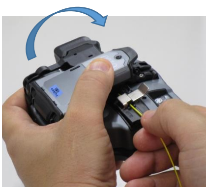
4 ) Trennen Sie die Faser