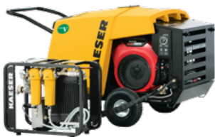
Kaeser MOBILAIR-M17-SET Baukompressor mit Nachkühler