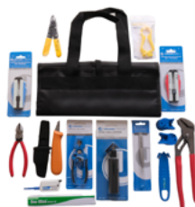
OPTERNUS Werkzeugset Kabel-/ Rohrbearbeitung Werkzeugzusammenstellung für die NE3/NE4