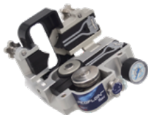
Fremco Picoflow RAPID Einblasgerät für NE4/5

Optionales Zubehör und alternative Geräte