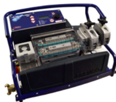
Fremco Easyflow SMART Einblasgerät bis zu 3,5km und Rohre bis zu 40mm