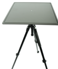
OPTERNUS Stativ & Platte Massive Montageplatte