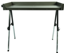
OPTERNUS Montage- & Spleisstisch Multifunktional und leicht