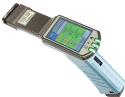
FID-30R Faseridentifizierer mit integriertem Pegelmesser