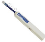
OCC-B Reinigungsstift für 1,25mm Ferrulen