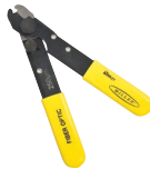
FO 103-S Millerzange von 250 auf 125µm