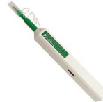
OCC-A Reinigungsstift für 2,5mm Ferrulen