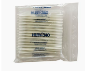
B-002 feine Wattestäbchen