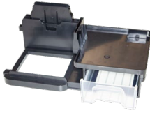
WT-09R Arbeitsplattform rechts