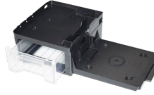
WT-09L Arbeitsplattform links