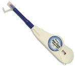
MPO-CLK-D OCC-Reinigungsstift für MPO Stecker