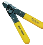
FO 103-T-250-J Millerzange 3-Loch 2 oder 3 mm 900 auf 250µm 250 auf 125µm