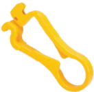
80980 FTS autom. Anritzvorrichtung für Bündeladern von 1,5 bis 6mm