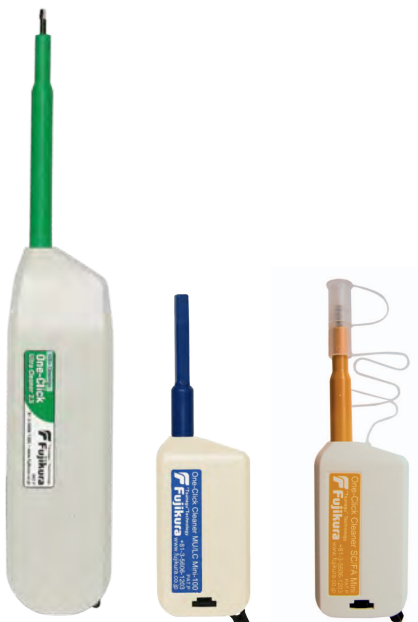
OCC-2,5 U (SC/ST/FC)