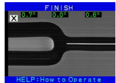
Spleiss von 400 auf 125µm

Das Faserhaltersystem, das eigens für das FSM-45F entwickelt wurde, gewährleistet eine besonders einfache Handhabung.